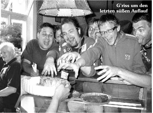
G'wiss um den letzten süßen Auflauf