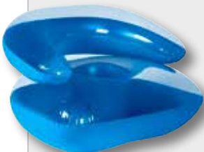
Ab 100 verkauften Losen: Aufblasbarer Sessel