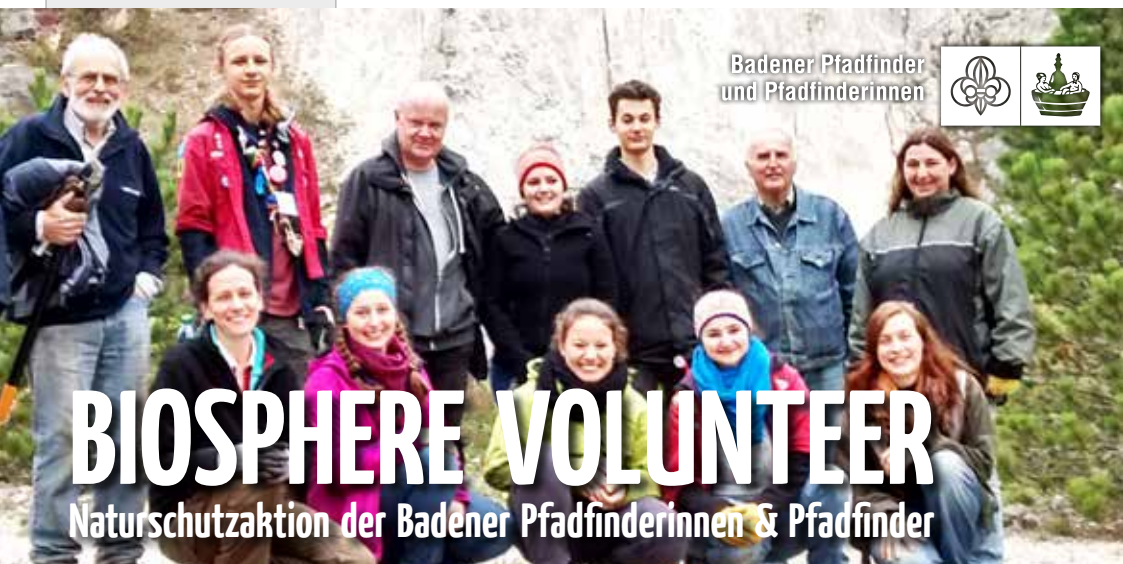
Badener Pfadfinder und Pfadfinderinnen