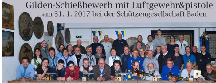
Gilden-Schießbewerb mit Luftgewehr & Pistole am 31. 1. 2017 bei der Schützengesellschaft Baden