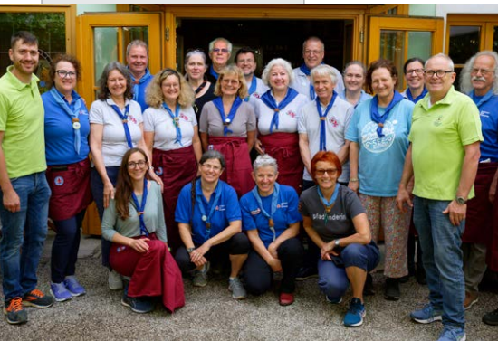
Team am Samstag