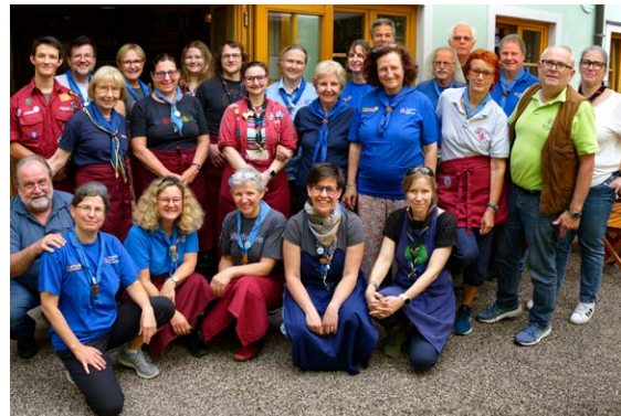
Team am Sonntag