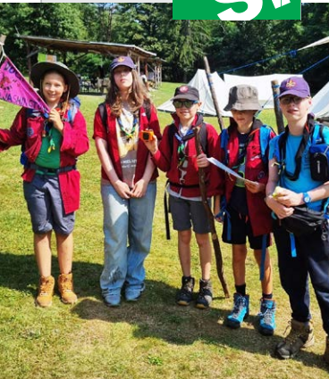
Patroulle Dog Washington