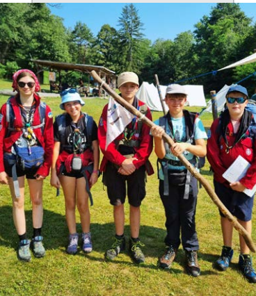
Patroulle Einstein Eulen Stargast Knossi